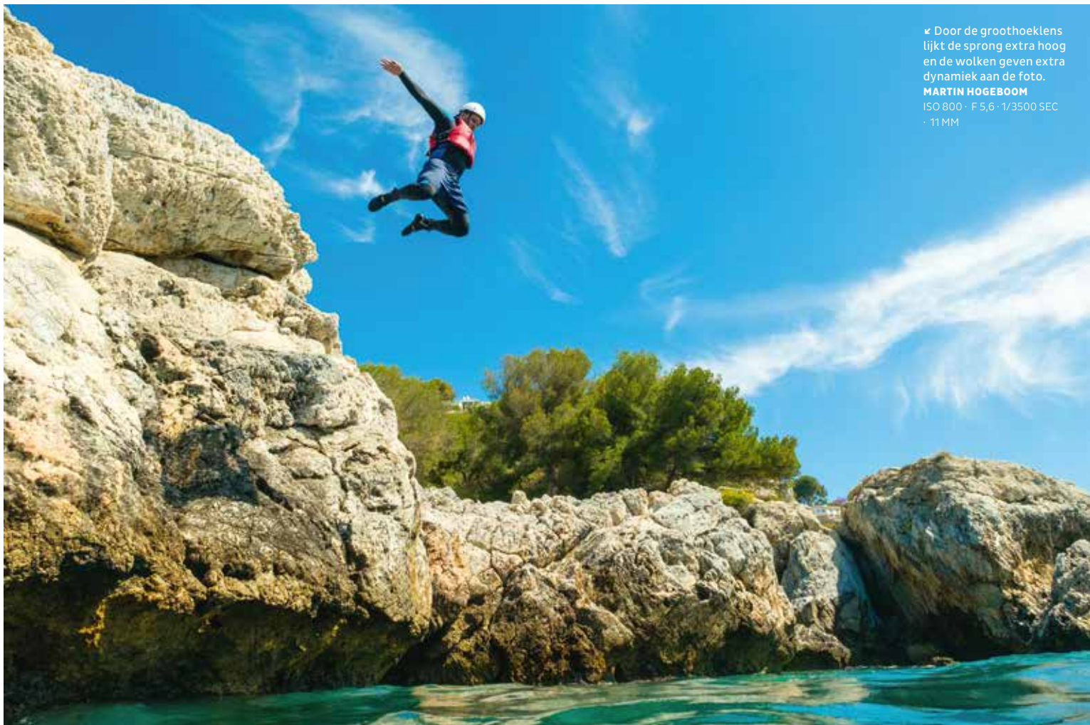
◀ Door de groothoeklens lijkt de sprong extra hoog en de wolken geven extra dynamiek aan de foto. ISO 800 · F 5,6 · 1/3500 SEC · 11 MM