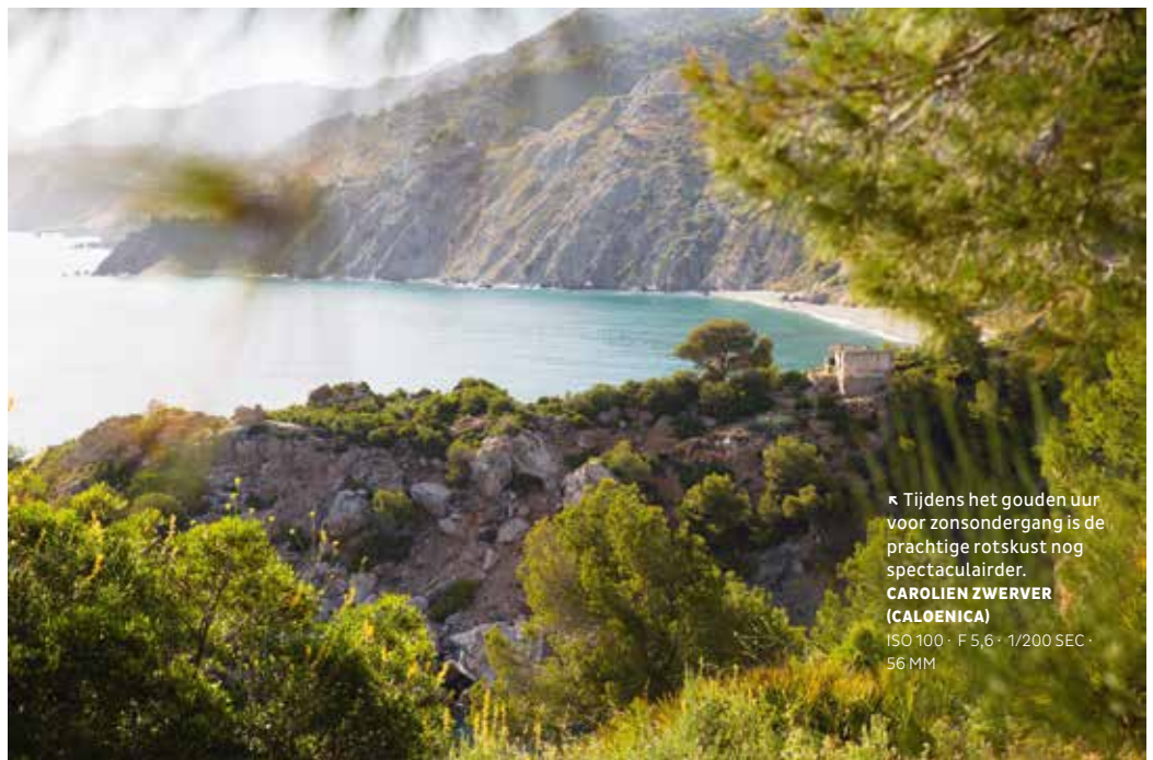
κ Tijdens het gouden uur voor zonsondergang is de prachtige rotskust nog spectaculairder. CAROLIEN ZWERVER (CALOENICA) ISO 100 · F 5,6 · 1/200 SEC · 56 MM