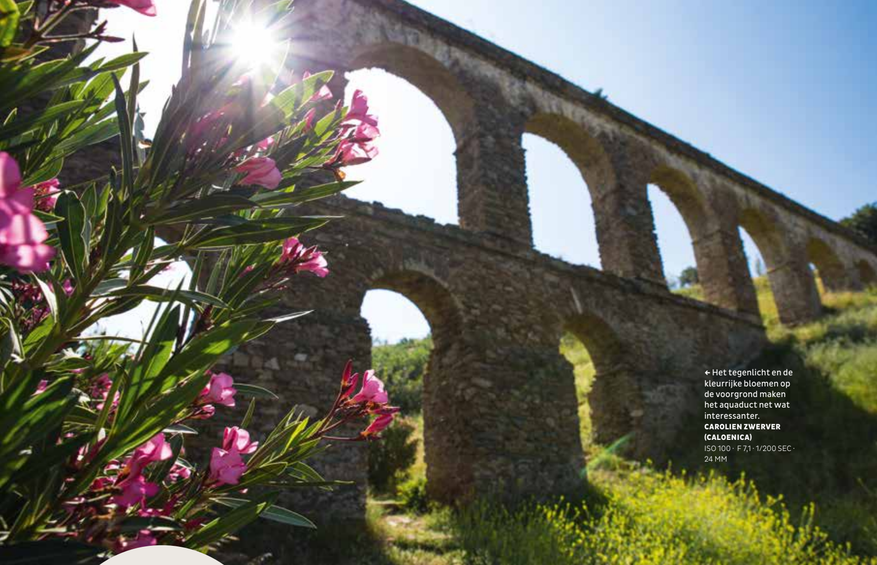
← Het tegenlicht en de kleurrijke bloemen op de voorgrond maken het aquaduct net wat interessanter. ISO 100 · F 7,1 · 1/200 SEC · 24 MM